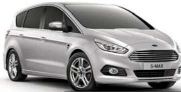
Moon dust Silver