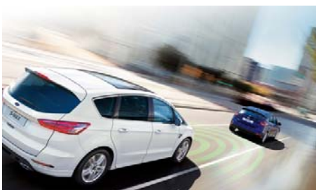
Active City Stop