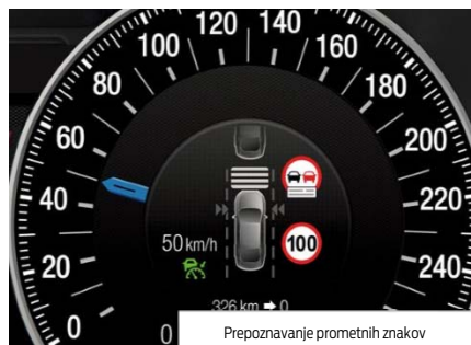
Prepoznavanje prometnih znakov