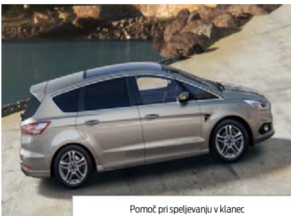
Pomoč pri speljevanju v klanec