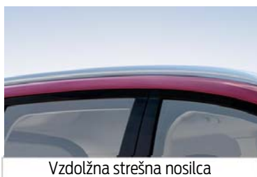
Vzdolžna strešna nosilca