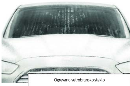
Ogrevano vetrobransko steklo

Brez ključa pomeni brez napora - Fordov sistem KeyFree za odklepanje brez ključa vam omogoča zaklepanje in odklepanje avtomobila, ne da bi morali vzeti ključ iz žepa ali torbe, kar je idealno, ko imate polne roke.