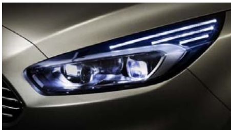
Dinamična žarometna s tehnologijo LED