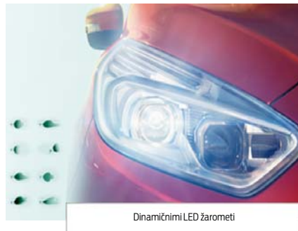
Dinamičnimi LED žarometi