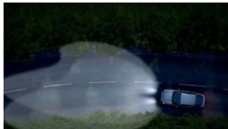
Aktivno prilagajanje svetlobnega snopa 'Ford Dynamic LED'