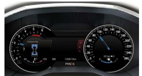
Digitalni sistem merilnikov