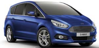
Deep Impact Blue