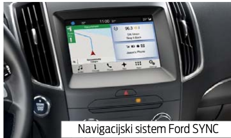
Navigacijski sistem Ford SYNC